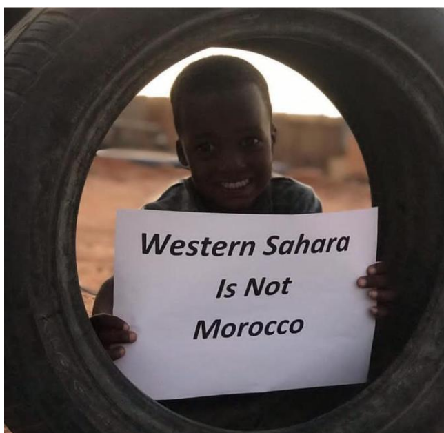
(@AhmedNafusa, 3 likes).